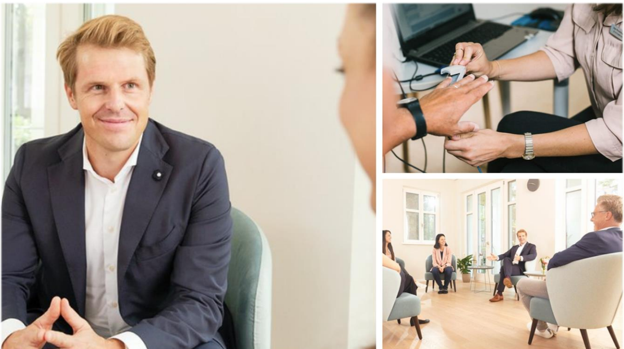
Therapie-Dreiklang für eine ganzheitliche Behandlung: Mensch, Wissenschaft und Atmosphäre.

Die Oberberg Tagesklinik München Bogenhausen bietet den Patienten in zentraler Lage und gehobenem Ambiente einen Ort der Ruhe und Achtsamkeit in unmittelbarer Nähe zum Englischen Garten. Die Tagesklinik steht für eine hochwertige und individuelle State-of-the-Art-Behandlung, die perfekt auf die persönlichen Bedürfnisse der Patienten zugeschnitten ist. Das allgemeine Behandlungskonzept der Oberberg Kliniken basiert auf einem ganzheitlichen Menschenbild. Bei der Diagnostik werden neben den körperlichen und seelischen Symptomen auch die gesamte Person mit ihrer Biografie, ihrer Persönlichkeit und ihrem sozialen Umfeld betrachtet. Dabei wird stets auf dem neuesten Stand der Wissenschaft gearbeitet und in einer Atmosphäre, in der sich die Patienten wohl und geborgen fühlen. Um bestmögliche Therapieergebnisse zu erreichen und den höchsten Qualitätsansprüchen gerecht zu werden, erfolgt die Behandlung der Patienten nach einem verbindlichen Prinzip: innovativ, intensiv und individuell.