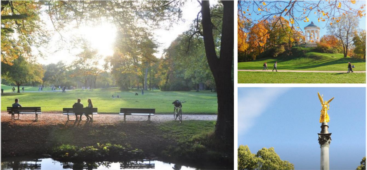
Die Oberberg Tagesklinik München Bogenhausen liegt in idyllischer Lage im Herzen der Stadt.

die umliegenden Autobahnen A8, A94 sowie A99 in wenigen Autominuten über den „Mittleren Ring“ zu erreichen.