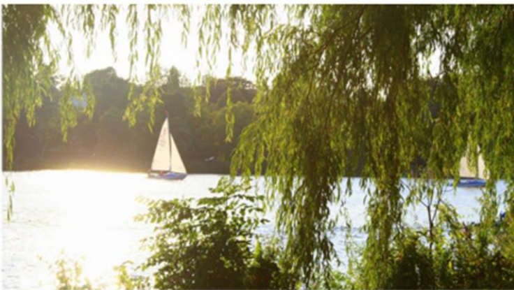
Die Oberberg Tagesklinik Hamburg im Herzen der Stadt.