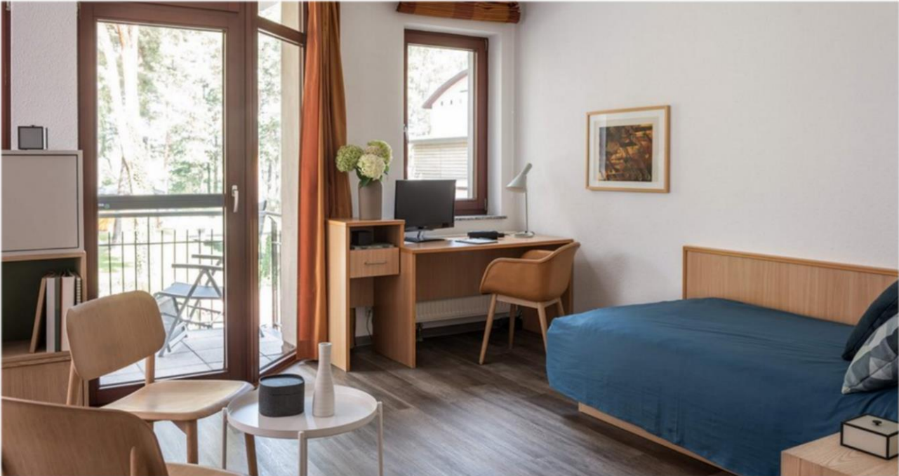
Patientenzimmer mit Wohlfühlatmosphäre.