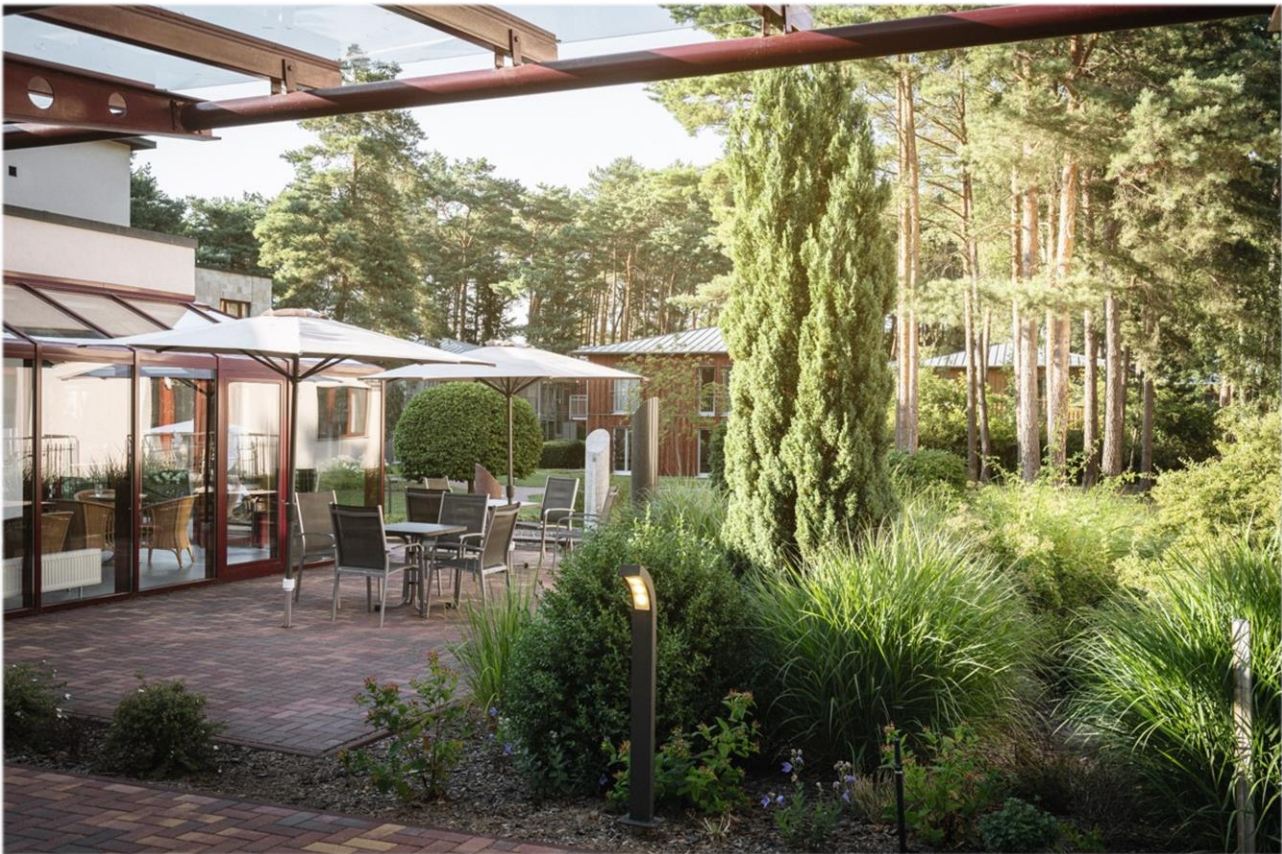
Oberberg Fachklinik Berlin Brandenburg.

Die Oberberg Fachklinik Berlin Brandenburg ist eine private Akutklinik für Psychiatrie, Psychosomatik und Psychotherapie. Idyllisch im Wald direkt am Großen Glubigsee gelegen, bietet sie professionelle Hilfe und eine Behandlung auf höchstem Niveau. Die Oberberg Fachklinik Berlin Brandenburg ist ein Ort der Ruhe, Achtsamkeit und Neuorientierung – ein Ort der Heilung. Das allgemeine Behandlungskonzept der Oberberg Kliniken basiert auf einem ganzheitlichen Menschenbild. Bei der Diagnostik werden neben den körperlichen und seelischen Symptomen auch die gesamte Person mit ihrer Biografie, ihrer Persönlichkeit und ihrem sozialen Umfeld betrachtet. Dabei wird stets auf dem neuesten Stand der Wissenschaft gearbeitet und in einer Atmosphäre, in der sich die Patienten wohl- und geborgen fühlen. Um bestmögliche Therapieergebnisse zu erreichen und den höchsten Qualitätsansprüchen gerecht zu werden, erfolgt die Behandlung der Patienten nach einem verbindlichen Prinzip: innovativ, intensiv und individuell.