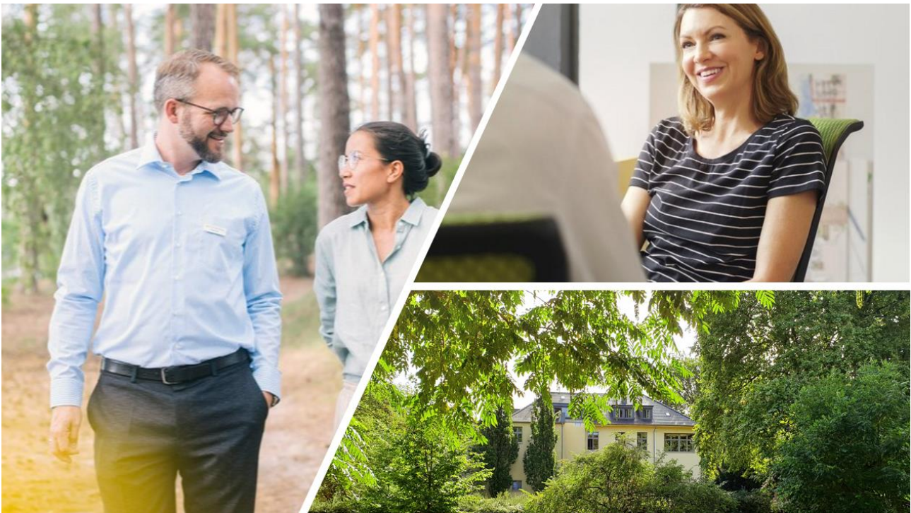
Therapie-Dreiklang für eine ganzheitliche Behandlung: Mensch, Wissenschaft und Atmosphäre.

Die Oberberg Tagesklinik Essen in unmittelbarer Nähe zum Stadtgarten bietet in ruhiger, zentraler Lage und gehobenem Ambiente einen Ort, der zu Achtsamkeit und innerer Sammlung einlädt. Die Tagesklinik schafft somit optimale Voraussetzungen zur Neuausrichtung des Lebens für die Patienten. Die Oberberg Tagesklinik Essen steht für eine hochwertige und individuelle achtsamkeitsbasierte Behandlung, die genau auf die persönlichen Bedürfnisse der Patienten zugeschnitten ist. Das allgemeine Behandlungskonzept der Oberberg Kliniken basiert auf einem ganzheitlichen Menschenbild. Bei der Diagnostik werden neben den körperlichen und seelischen Symptomen auch die gesamte Person mit ihrer Biografie, ihrer Persönlichkeit und ihrem sozialen Umfeld betrachtet. Dabei wird stets auf dem neuesten Stand der Wissenschaft gearbeitet und in einer Atmosphäre, in der sich die Patienten wohl und geborgen fühlen. Um bestmögliche Therapieergebnisse zu erreichen und den höchsten Qualitätsansprüchen gerecht zu werden, erfolgt die Behandlung der Patienten nach einem verbindlichen Prinzip: innovativ, intensiv und individuell.