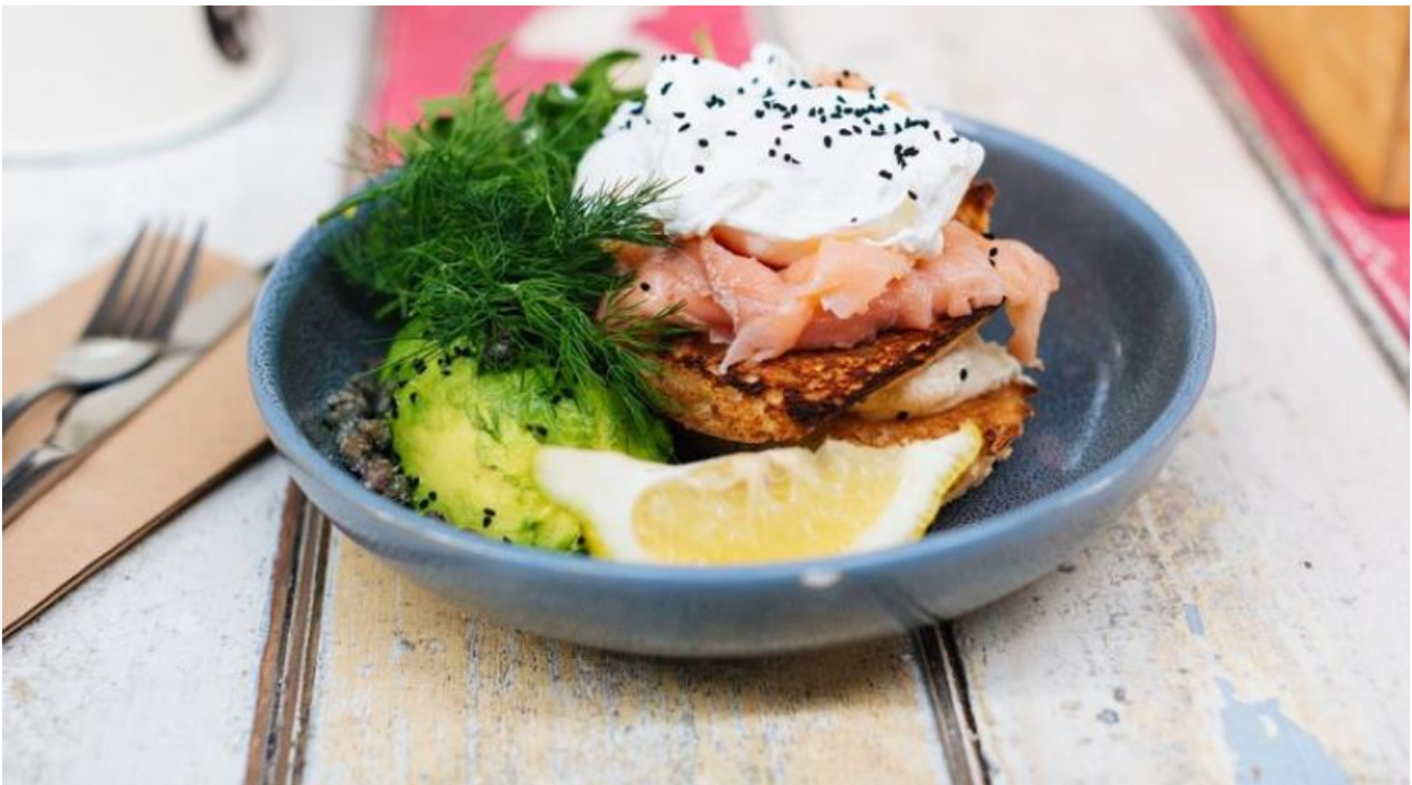
Täglich auf der Speisekarte: Eine ausgewogene Ernährung.