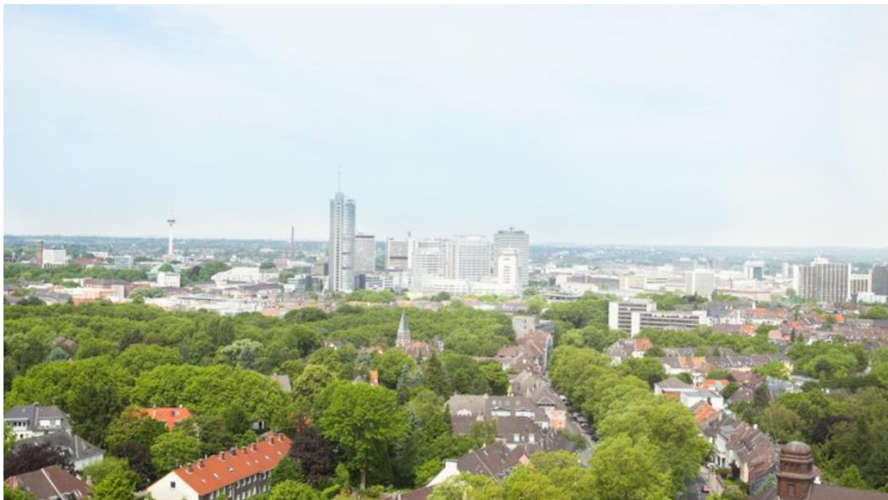
Die Oberberg Tagesklinik Essen in zentraler Lage in der Essener Innenstadt.

ca. 10 Minuten zu erreichen. Zudem halten die U-Bahnen und Straßenbahnen (U-11 Gelsenkirchen bis Messe, 107 und 108 HBF bis Bredeney) an der Philharmonie (5 Minuten Fußweg). Schließlich verbindet die Buslinie 145 den Hauptbahnhof mit dem Essener Süden und hält am Stop "Essen Hohenzollernstraße" direkt vor der Tagesklinik.